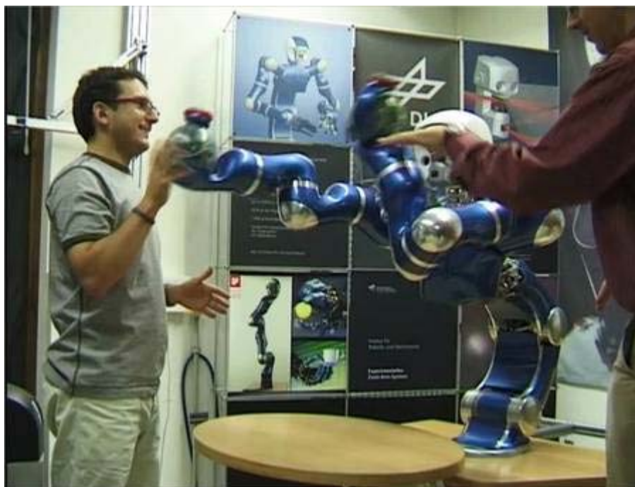
Des chercheurs allemands jouent avec un robot armé de deux bras LWR, qui ne devront jamais blesser. Cette image est extraite d'une des vidéos proposées par le laboratoire.

Par exemple, le bras VSA est actionné par des moteurs antagonistes, produisant des mouvements opposés. C'est d'ailleurs ainsi que fonctionnent le contrôle musculaire d'un membre chez un animal. Dans le bras LWR de l'équipe allemande du DLR, les capteurs sont intégrés et installés au niveau de chaque articulation. Le système repère donc facilement tout choc, même minime.