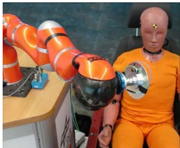
Un « crash test » impliquant le bras robotique mis au point au DLR (Allemagne). Le bras s'apprête à simuler ce que ne devrait jamais faire un robot : frapper un être humain.